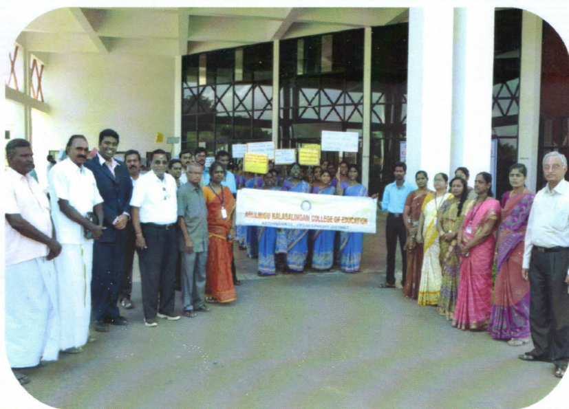
Youth Awakening Day